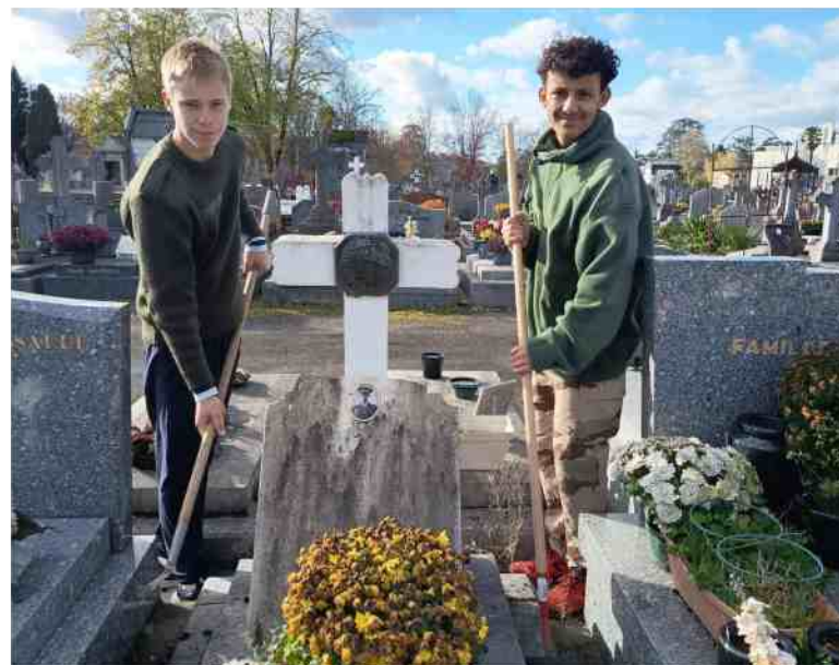
Les élèves sont intervenus sur des tombes du cimetière urbain. Jean-Pierre Le Guinio

Ce lien privilégié vise à favoriser les échanges avec les militaires et à transmettre les valeurs républicaines, tout en développant la culture de l'engagement. Selon lui, travailler sur l'embellissement des tombes permet aux jeunes de mieux comprendre le parcours de ces soldats souvent à peine plus